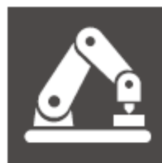
機械・制御エンジニア科